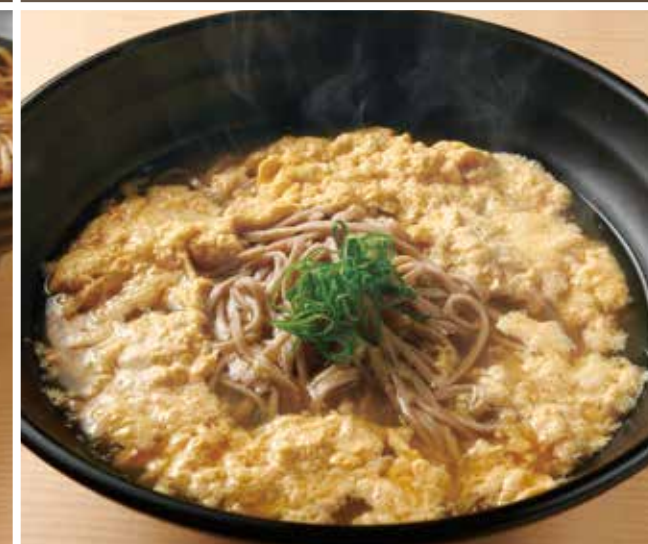
玉子とじのおそば