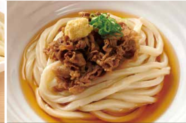
牛肉ぶっかけのおうどん 1,150円