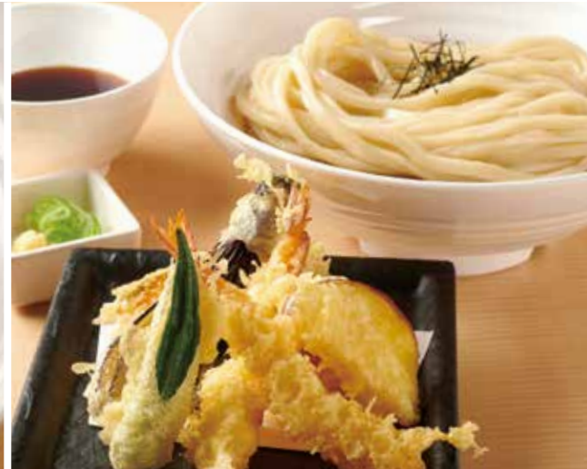
天ざるのおうどん 1,150円