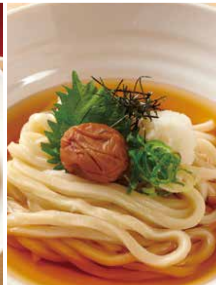
梅おろしのおうどん 850円