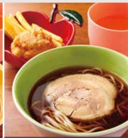
お子様ラーメン 450円

商品に含まれない他の食材が店頭で付着・混入する場合があります。あらかじめご了承ください。※価格はすべて税込です。