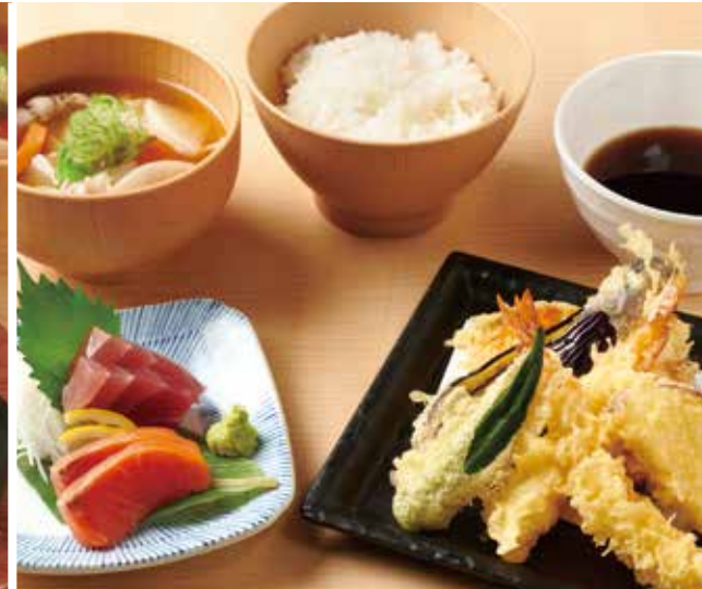
お造りと天ぷら定食 1,380円