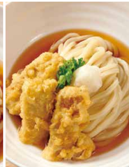
鶏天のおうどん 900円