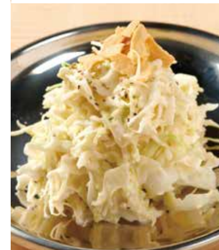
コールスローキャベツ