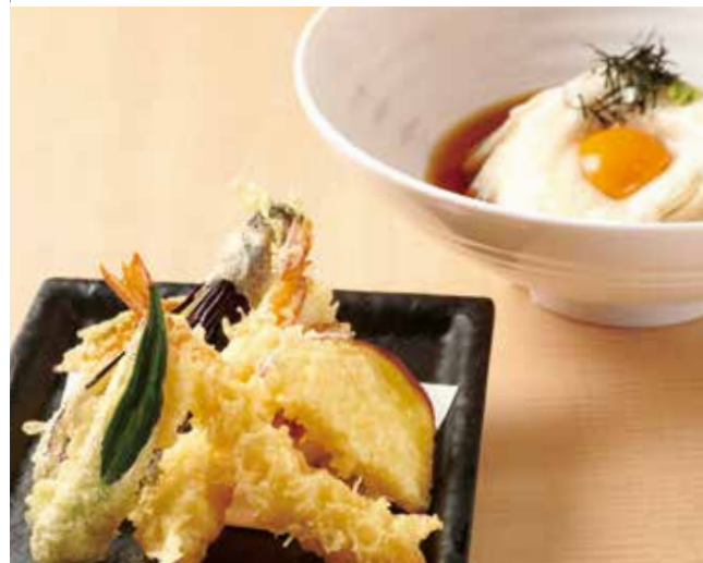
天山かけのおうどん 1,350円