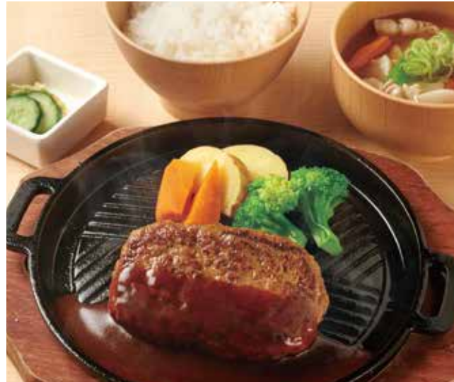
ハンバーグ定食 1,300円