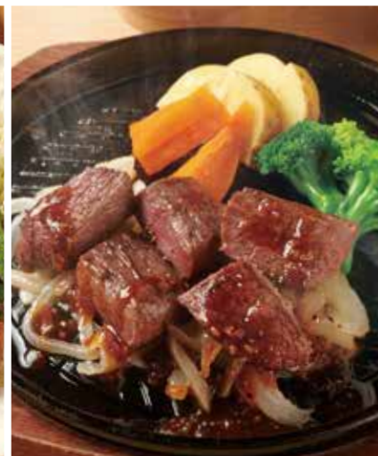
サイコロステーキ定食 1,700円