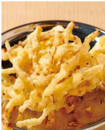
さきいかの天ぷら 480円