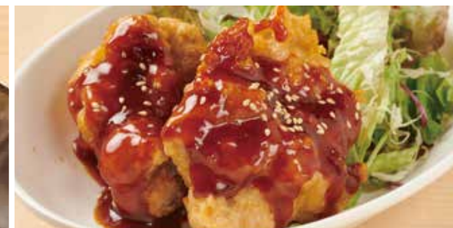
ヤンニョムチキン