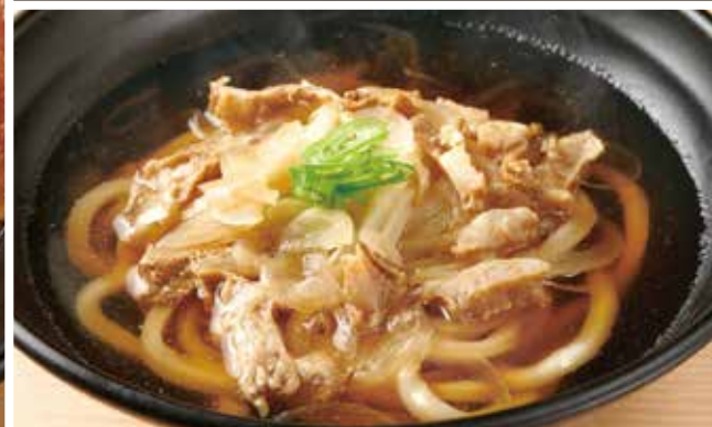
脂かすのおうどん 900円