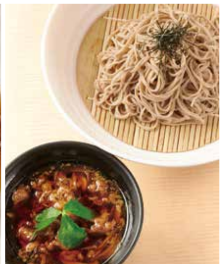
牛肉つけ汁のおそば