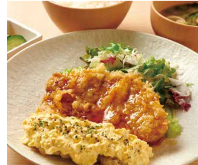
チキン南蛮定食 1,120円