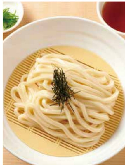
ざるのおうどん 650円