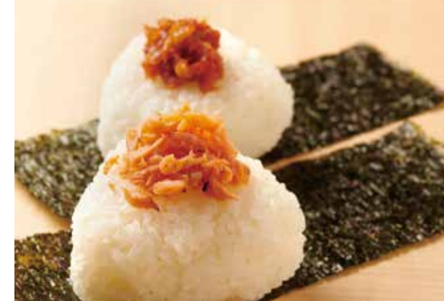
梅おにぎり 250円 鮭おにぎり 250円