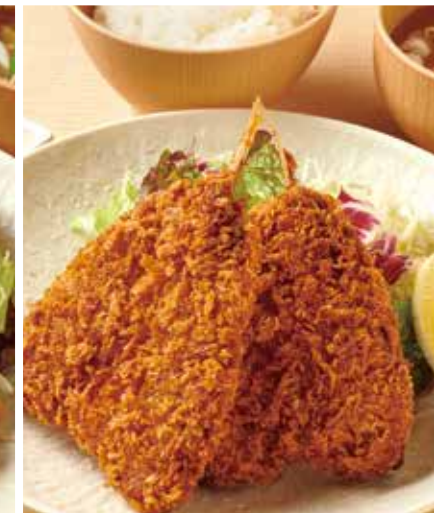
大きなアジフライ定食 1,000円