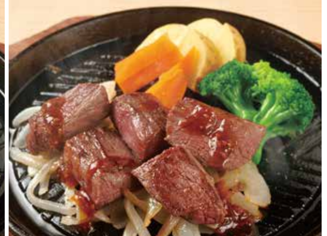
サイコロステーキ 1,480円