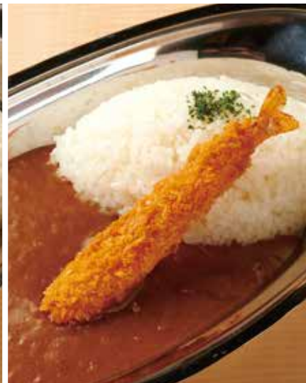
エビフライカレー 880円