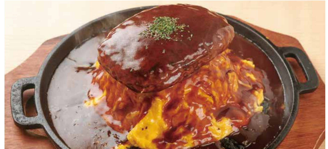
オムライスハンバーグ 1,480円