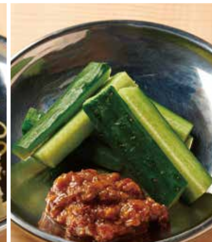
もろ味噌きゅうり