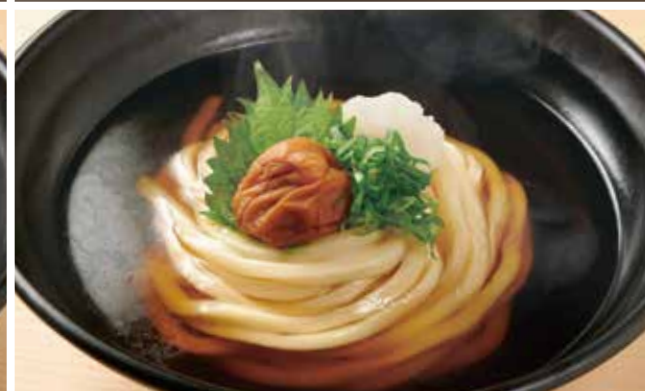
梅干しのおうどん 850円