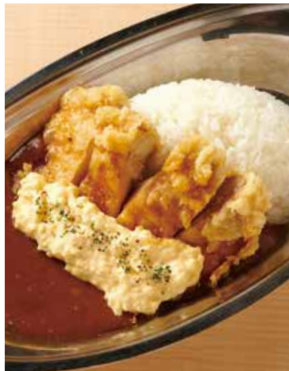
チキン南蛮カレー 1,150円