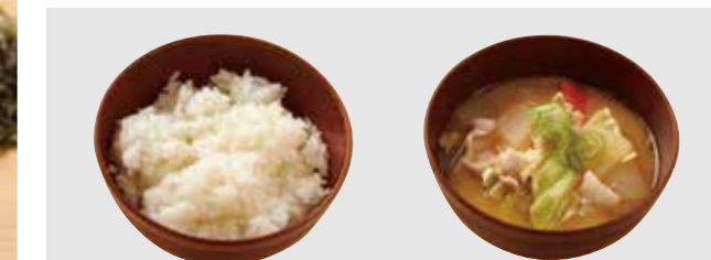
白ごはん 200円 豚汁 300円