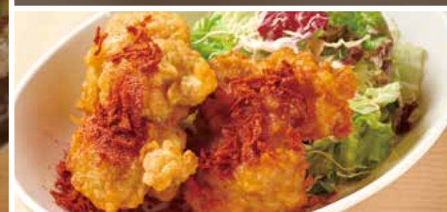
ケイジャンチキン