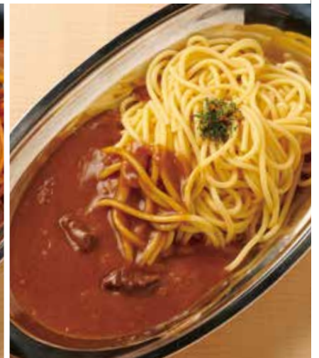
カレースパゲティ 750円