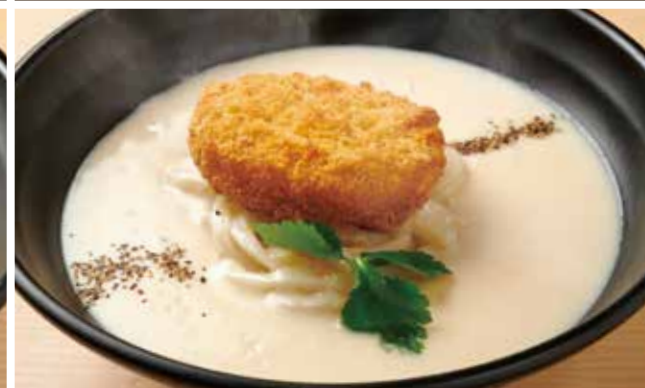
コロッケクリームのおうどん 950円