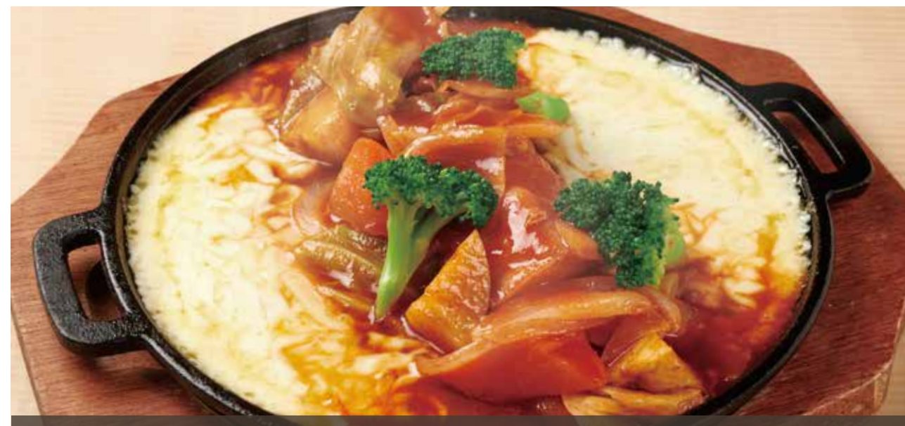
チーズダッカルビ