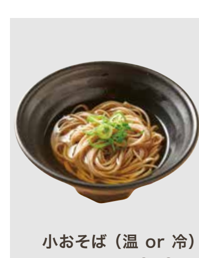
小おそば (温 or 冷) 250円