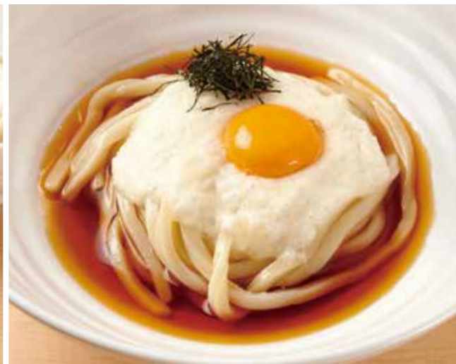
山かけのおうどん 850円