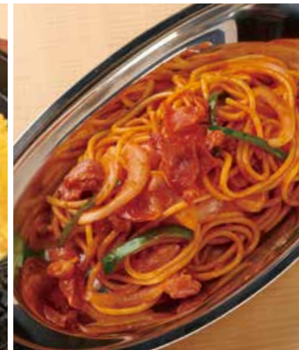
下町ナポリタン 680円