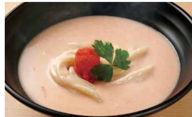
明太子クリームのおうどん 1,000円