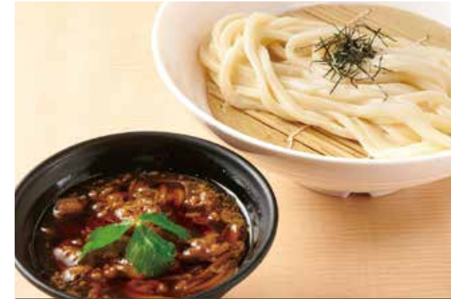
牛肉つけ汁のおうどん 1,100円