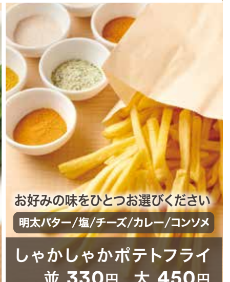
お好みの味をひとつお選びください 明太バター/塩/チーズ/カレー/コンソメ しゃかしゃかポテトフライ 並 330円 大 450円 特大 570円