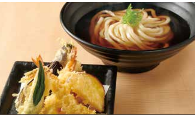
天ぶらのおうどん 1,150円