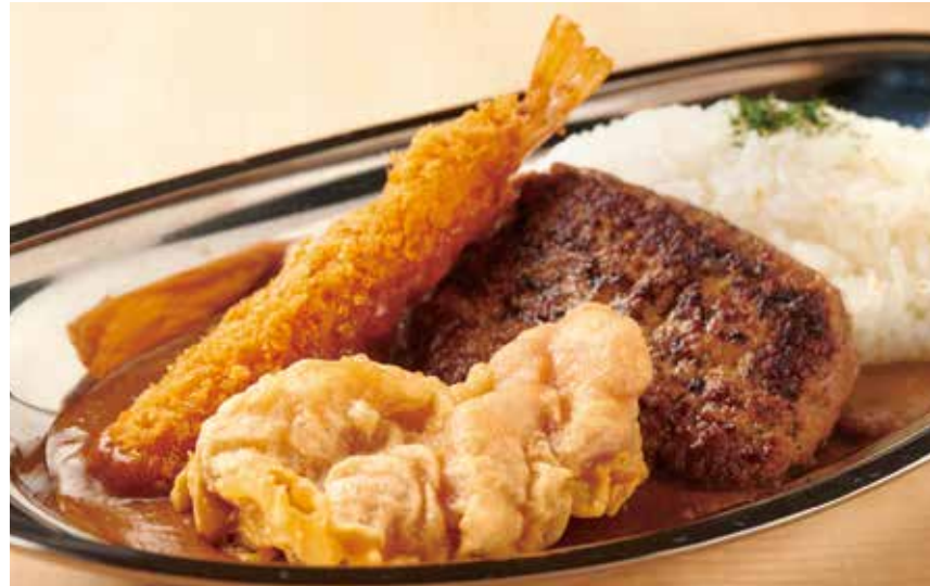
全部のせスペシャルカレー 1,680円