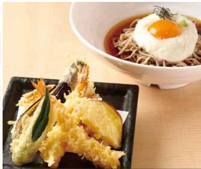
天山かけのおそば