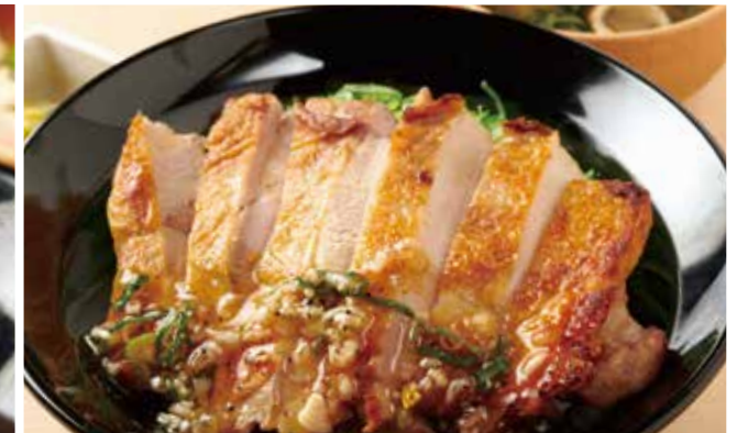
鶏ねぎ塩ステーキ丼 950円