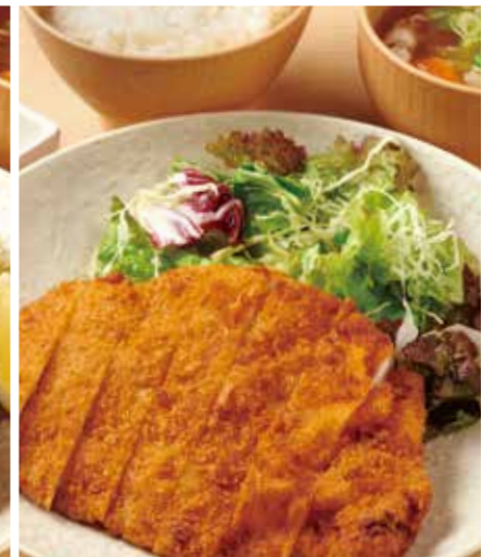
大きなチキンカツ定食 1,200円