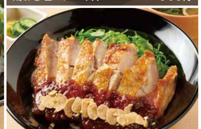
鶏ガーリックステーキ丼 950円