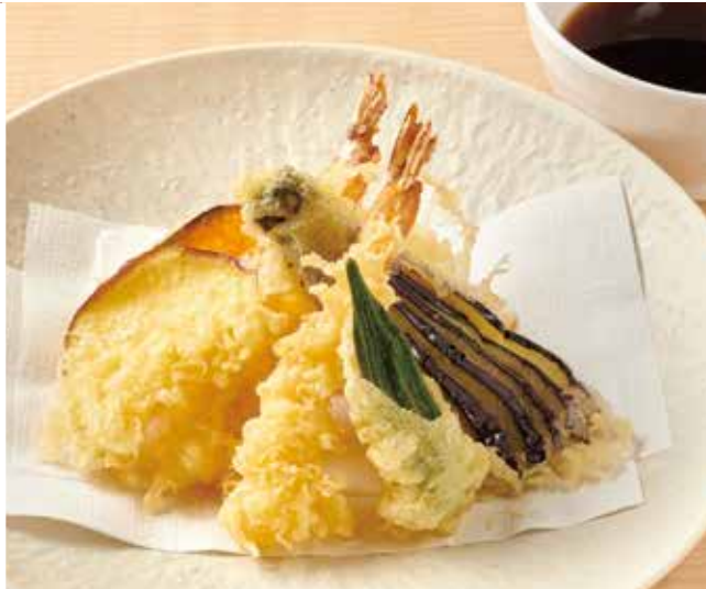
天ぷら盛り合わせ 780円