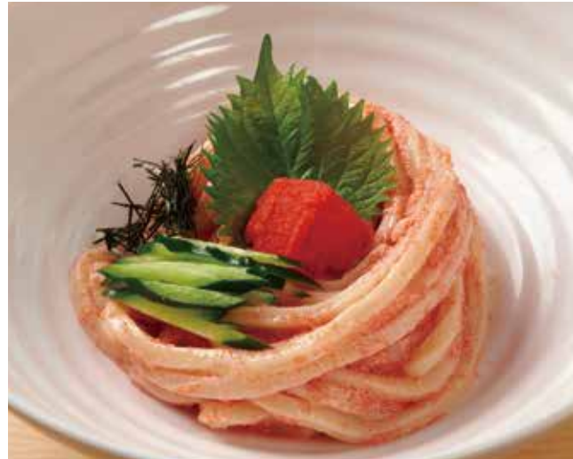
明太子のおうどん 900円