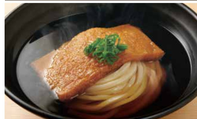
きつねのおうどん 700円