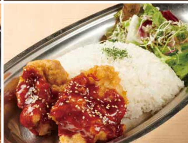
ヤンニョムチキンプレート