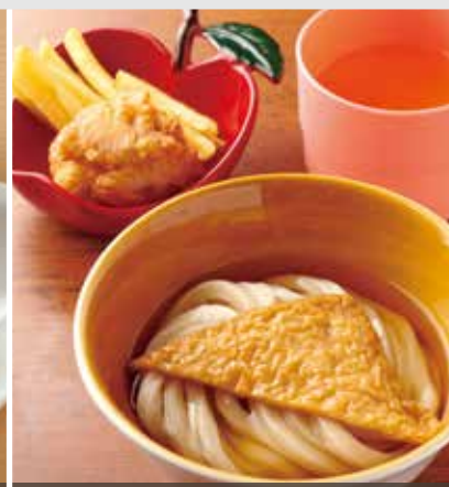
お子様うどん[温・冷] 450円