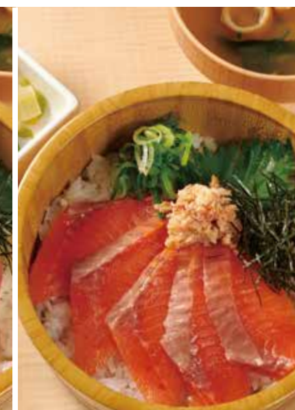
サーモンおひつご飯 1,200円