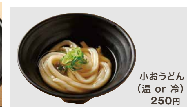
小うどん (温 or 冷) 250円