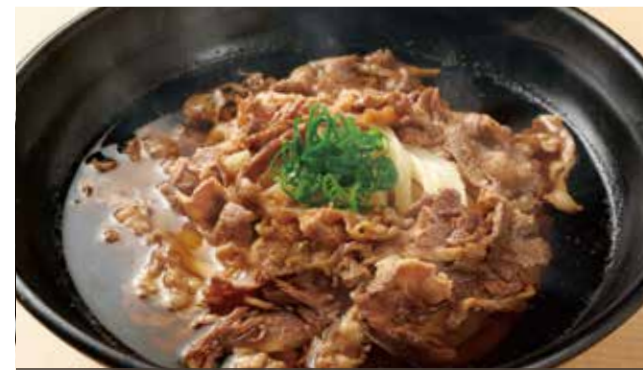
牛肉のおうどん 1,150円