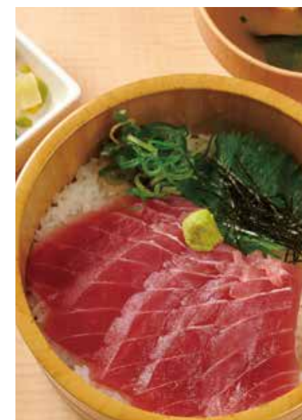
まぐろおひつご飯 1,100円