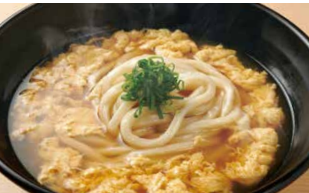
玉子とじのおうどん 700円