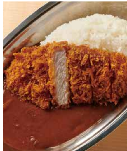
とんかつカレー 1,230円