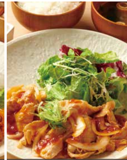
豚生姜焼き定食 980円