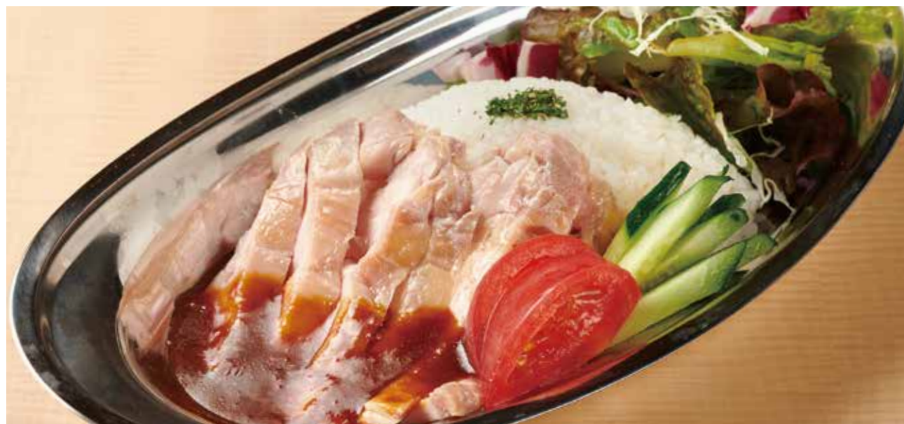
カオマンガイプレート