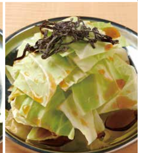
ぱりぱりキャベツ