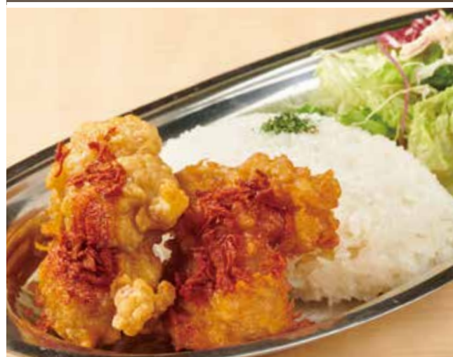
ケイジャンチキンプレート