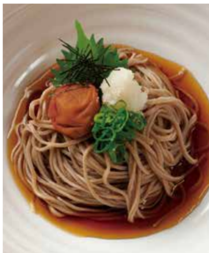
梅おろしのおそば