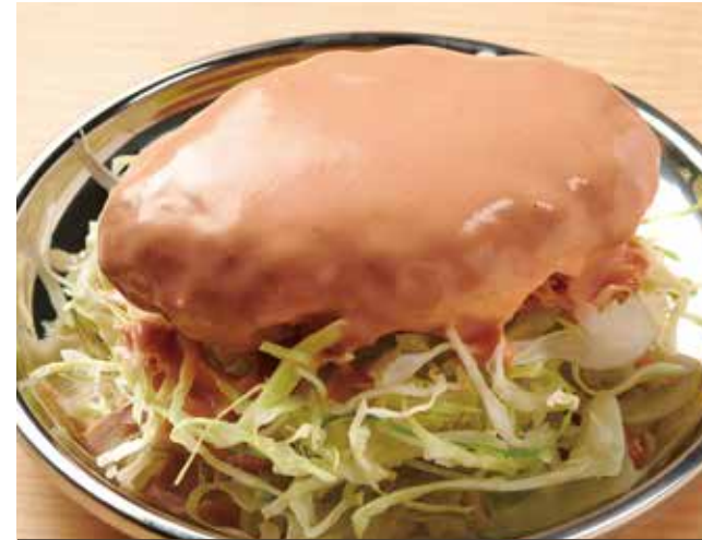
美味しいコロッケ 280円