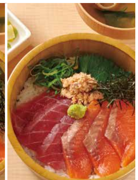
まぐろサーモンおひつご飯 1,200円