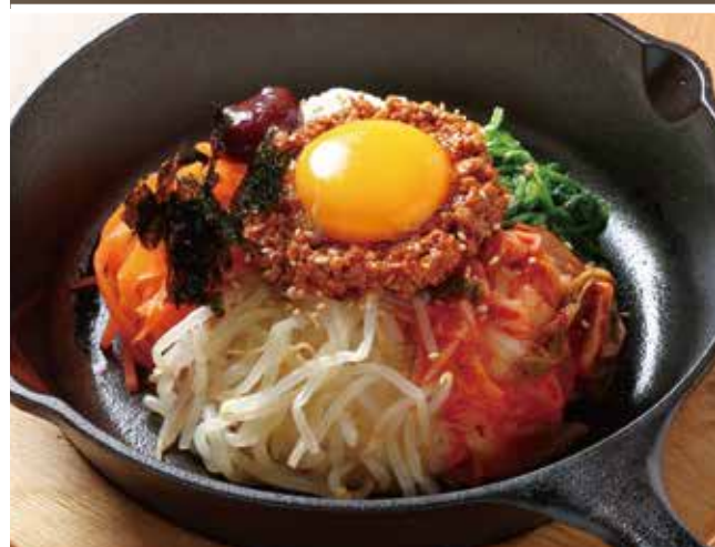
スキレットビビンバ