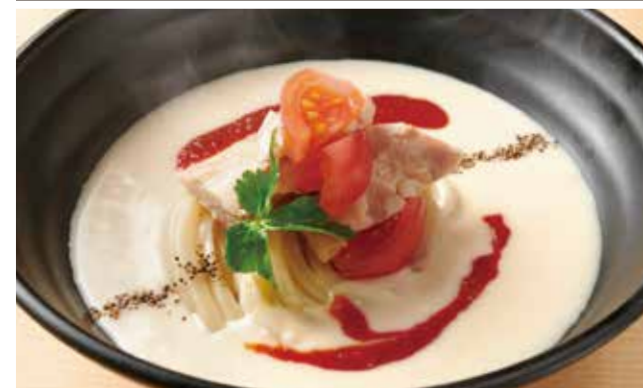
トマトクリームのおうどん 1,000円