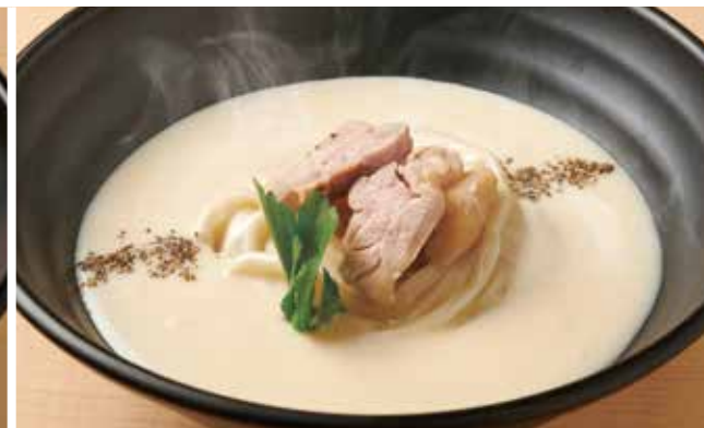
鶏クリームのおうどん 950円